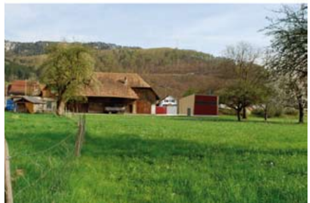
Fotomontage des Hunzikerhofs mit der Energiezentrale